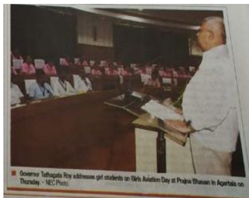
■ Governor Tathagata Roy addresses girl students on Girls Aviation Day at Pragna Bhavan in Agartala on Thursday.

He also told that Northeast region has greater potentiality in aviation sector and the girls of the region can take the maximum facilities to make the career in aviation sector. There are several job opportu-