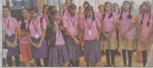
ಬೆಳಗಾವಿಯ ವಿಮಾನ ನಿಲ್ದಾಣದಲ್ಲಿ ಗರ್ಲ್ಸ್ ಇನ್ ಎವಿಯೇಷನ್ ಡೇ ಆಚರಿಸಲಾಯಿತು.

ಕಾರ್ಯಕ್ರಮ ಆಯೋಜಿಸಲಾಯಿತು ಎಂದರು. ವಿಶ್ವ ಹೋಲಿಸಿದರೆ ಭಾರತೀಯ ವೈಮಾನಿಕ ಕ್ಷೇತ್ರ ಅತಿ ಹೆಚ್ಚು ಮಹಿಳಾ ಫೈಲಟ್‌ಗಳನ್ನು ಹೊಂದಿದೆ. ಆದರೆ, ವೈಮಾನಿಕ ಕ್ಷೇತ್ರಕ್ಕೆ ಸಂಬಂಧಿಸಿದ ಇನ್ನೂ ಹಲವು ಉದ್ಘಾಟನೆಗಳಲ್ಲಿ ಮಹಿಳೆಯರಿಗೆ ಉತ್ತಮ ಉದ್ಯೋಗಾವಕಾಶಗಳಿದ್ದರೂ, ಅದನ್ನು