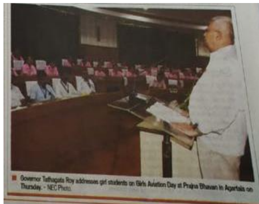
■ Governor Tathagata Roy addresses girl students on Girls Aviation Day at Pragna Bhavan in Agartala on Thursday.

He also told that Northeast region has greater potentiality in aviation sector and the girls of the region can take the maximum facilities to make the career in aviation sector. There are several job opportu-